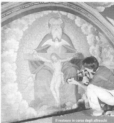
Il restauro in corso degli affreschi

Dando uno sguardo ai lavori di restauro compiuti in quest'ultimo periodo nella chiesa di Teregua, il primo lotto di opere, che ha preso avvio nell'ottobre 2007, ha portato alla scoperta dell'altare originario. Tra gli interventi realizzati la rimozione del vecchio pavimento con posa del relativo vespaio, costruzione della botolina di isolamento delle strutture murarie, posa delle tubazioni per la raccolta delle acque dei pluviali, il rifacimento del muretto a monte della chiesa. A questa prima fase di lavoro, conclusasi nello scorso novembre con la deumidificazione delle pavimentazioni, degli intonaci e delle murature, ha fatto seguito il secondo lotto di interventi iniziato il 7 aprile. La parte strutturale ed impiantistica dei lavori, seguita dall'architetto Stefano Trinzoni, ha riguardato in particolare il consolidamento statico dell'edificio, con chiusura delle lesioni mu-